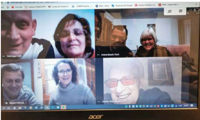
(A la foto hi manquen en Carlos i na Vicky, però si mirau amb atenció els veureu en un requadre petit, dalt a la dreta. Ells van fer sa foto)