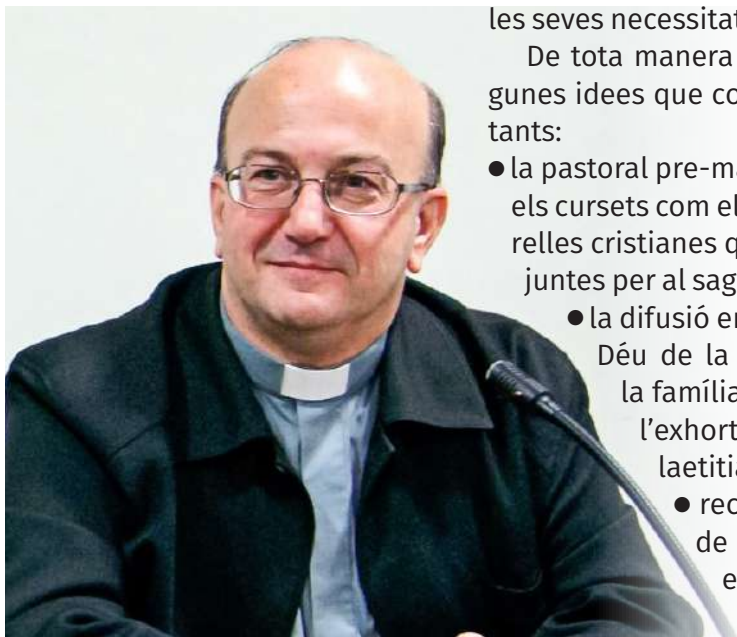
El Bisbe electe FRANCESC

Mn. Francesc Conesa Ferrer ha estat nomenat pel Papa pastor per a la nostra diòcesi. El 7 de gener de 2017, si Déu vol, serà consagrat bisbe a la Catedral de Menorca i, des d'aquell moment, començarà el seu servei entre nosaltres.