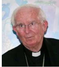
Cardenal Antonio Cañizares, actual Arzobispo de Valencia.